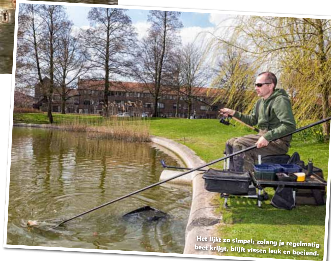
Het lijkt zo simpel: zolang je regelmatig beet krijgt, blijft vissen leuk en boeiend.

Beet krijgen is wat we allemaal willen. Het is voor velen de grootste motivatie om te gaan vissen en het verveelt werkelijk nooit. Een goed bestand aan vis is niet alleen voor een commerciële uitbater interessant, maar ook voor hengelsportverenigingen. Maar daar zit toch een adder onder het gras. Ter compensatie van dalende visvangsten op afgesloten wateren, worden er in enkele gevallen nog steeds grote partijen witvis gekocht van de beroepsvisserij.