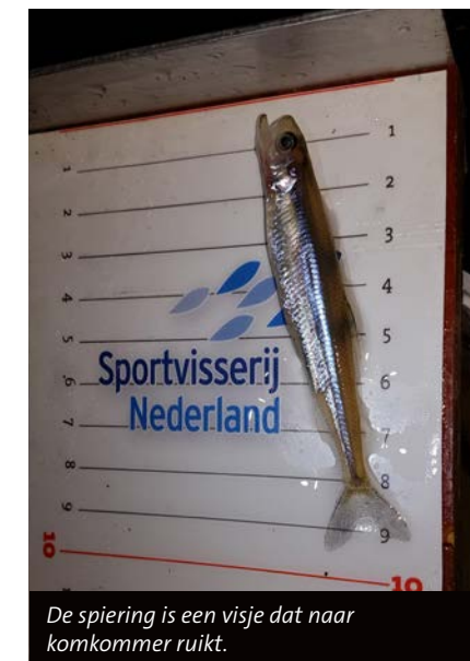
De spiering is een visje dat naar komkommer ruikt.