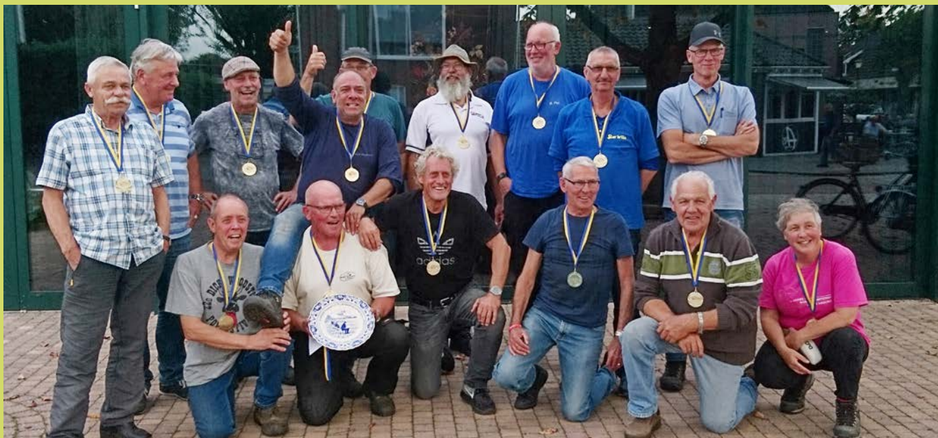
HSV Steenwijk wint het Federatief Clubkampioenschap in Oost-Nederland.