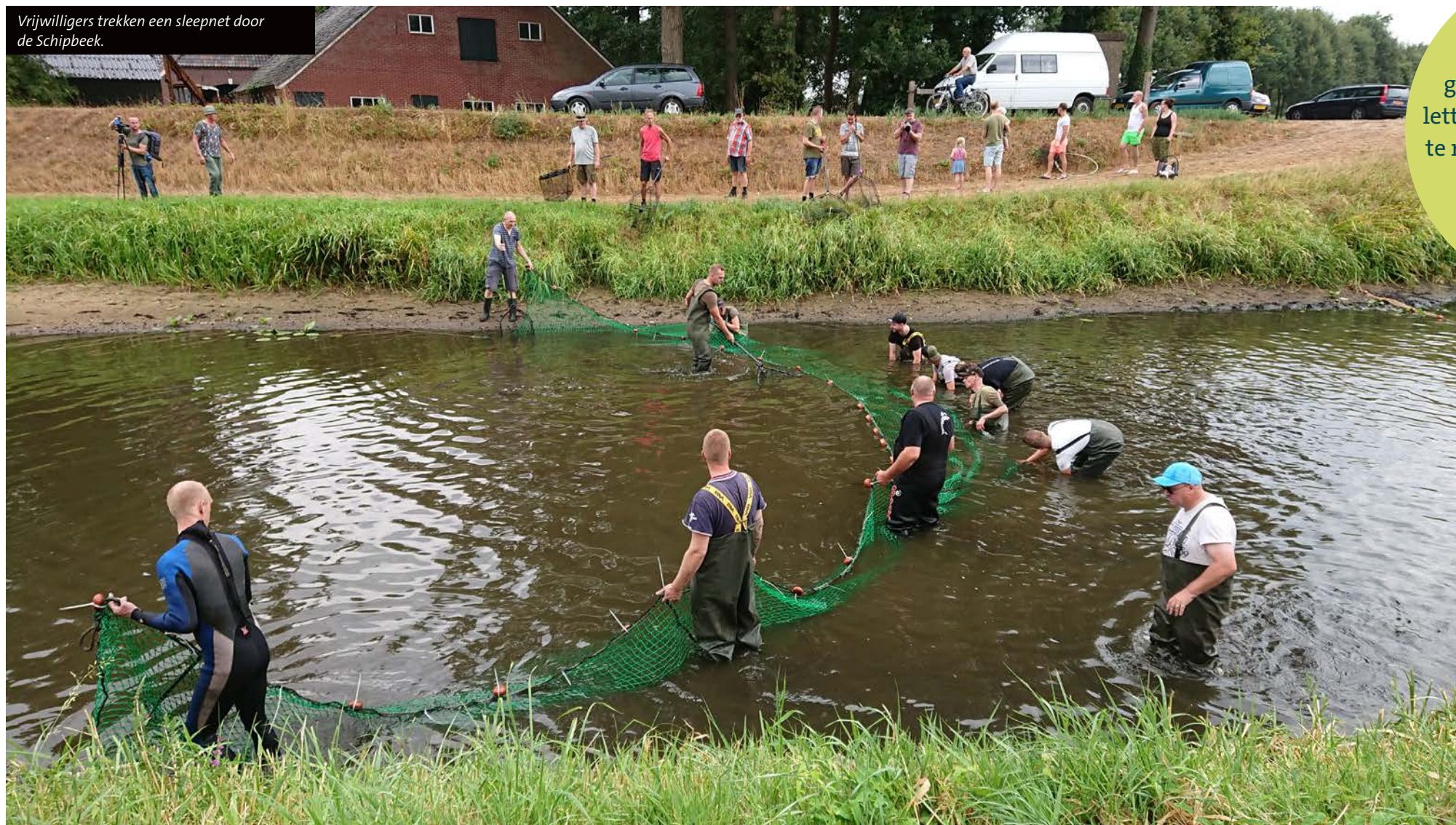
Vrijwilligers trekken een sleepnet door de Schipbeek.

Vele vrijwilligers gingen afgelopen zomer letterlijk te water om vissen te redden uit droogvallende beken en andere waterlopen