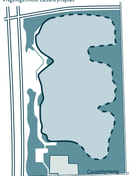
Noordoostpolder Visgelegenhed Casteleynsplas

— Wel betreden door hengelaars - - Niet betreden door hengelaars