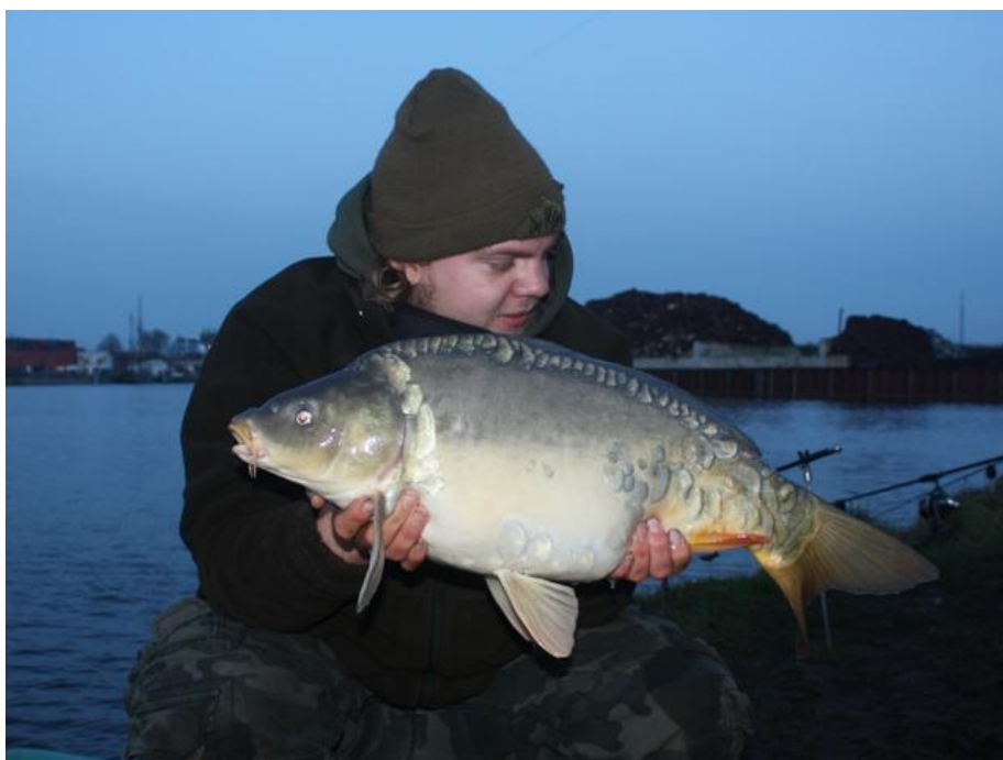
8. In één groeiseizoen groeide deze vis 3,7kg bij 14cm

Totaal kwamen het afgelopen jaar 44 meldingen van 36 unieke vissen van lichting 2 binnen. Het terugmeldpercentage komt daarmee op 20%, vergelijkbaar met de eerste lichting in 2012. Omdat deze vissen nog maar één groeiseizoen rondzwemmen en de meldingen verspreid over dat seizoen komen heeft het nog niet zo veel zin om te kijken naar groeigemiddelden over al deze meldingen. In de maanden november en december zijn 7 vissen van deze lichting gemeld, deze vissen, groeiden gemiddeld 3,3kg bij 14 cm. Ook de in de zomer gemelde vissen lieten een duidelijke groei zien, dus tot nu toe zijn ook voor deze lichting de vooruitzichten goed.