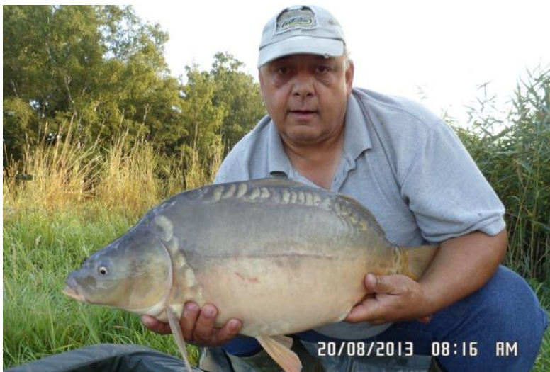
5. Deze vis ging 4 keer in een jaar in de fout