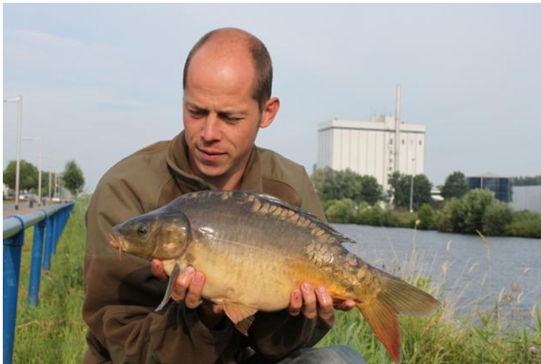
4. Één keer gevangen en dan weer voor langere tijd uit beeld

Op TK3 werd geen enkele vis meerdere keren gemeld. Niet verwonderlijk gezien het geringe totaal aantal terugmeldingen.