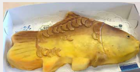
Een speciale taart, ter viering van de komende karperuitzettingen.

is het zover; dan worden de eerste karpers uitgezet en is de toekomst van een mooi karperbestand in deze kanalen tot in lengte van jaren gewaarborgd.