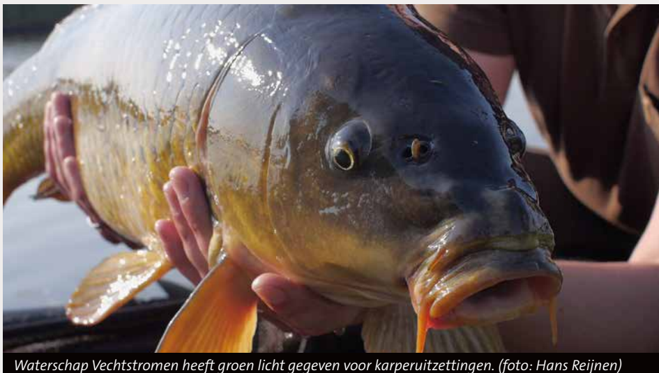
Waterschap Vechtstromen heeft groen licht gegeven voor karperuitzettingen.

De afgelopen jaren is de karperstand in verschillende kanalen flink achteruit gegaan door natuurlijke sterfte. Omdat de karperpopulatie zichzelf in deze wateren niet in stand kan houden, hebben Sportvisserij Oost Nederland, Hengelsportfederatie Groningen Drenthe en Sportvisserij Nederland een verzoek tot het uitzetten van karper ingediend bij het Waterschap Vechtstromen. Uiteindelijk met succes.