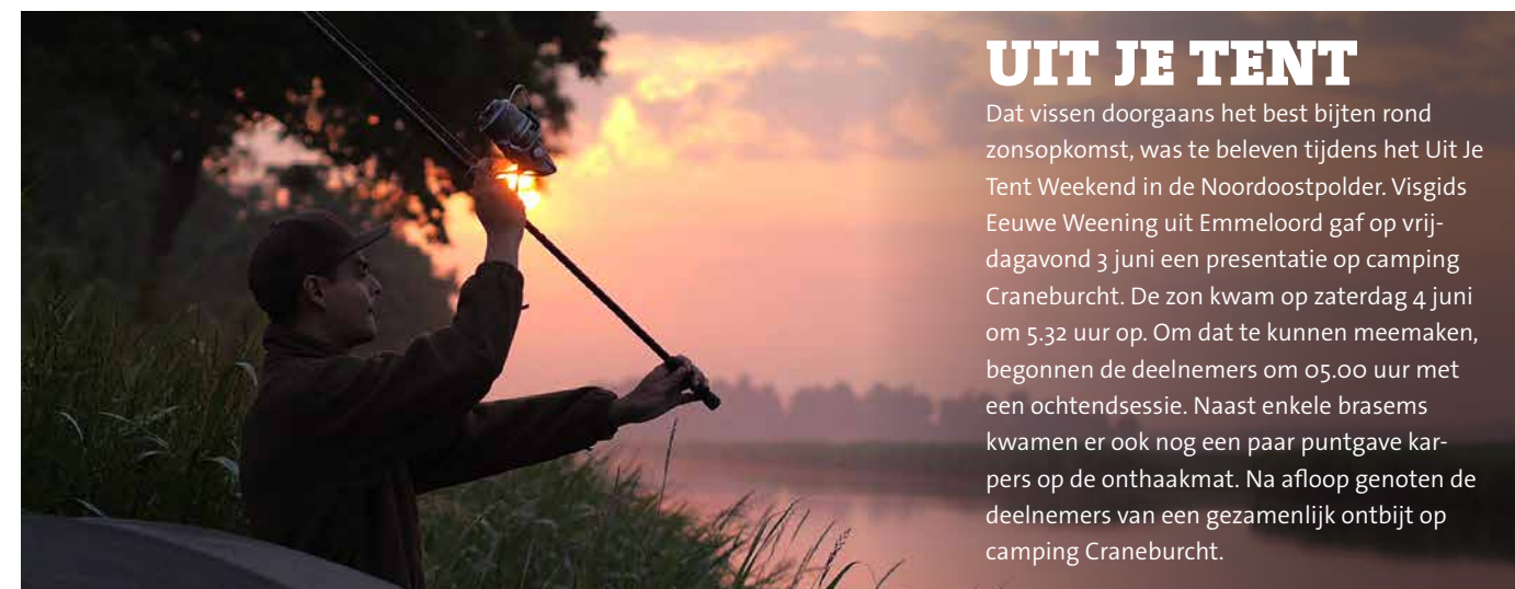
Vroege vogels tijdens het Uit Je Tent Weekend.

Wat is sportvissen nou eigenlijk? Om hiervan een mooie impressie te kunnen geven, hebben we deze zomer een pakkende promotiefilm over sportvissen gemaakt. Rode draad in deze film is de beleving van het sportvissen. Met deze film kunnen we ons werk als belangenbehartiger beter uitleggen aan organisaties en partijen waarmee we veelvuldig samenwerken. Ook zal de film gebruikt worden ter ondersteuning van presentaties en als promotie tijdens beurzen en evenementen.