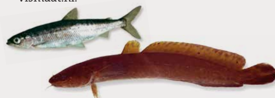
Kleine marene (boven) en een kwabaal.

Op verschillende locaties hebben sportvissers forel gevangen. In de Vecht bij de stuw van Junne ving een vliegvisser een flinke zeeforel van 43 centimeter. In juni was het raak op het Twentekanaal bij Almelo – daar kreeg een visser een beekforel aan de haak. Vang jij ook een bijzondere soort? Meldt het dan via info@sportvisserijooستنederland.nl en/of via www.mijnvismaat.nl .