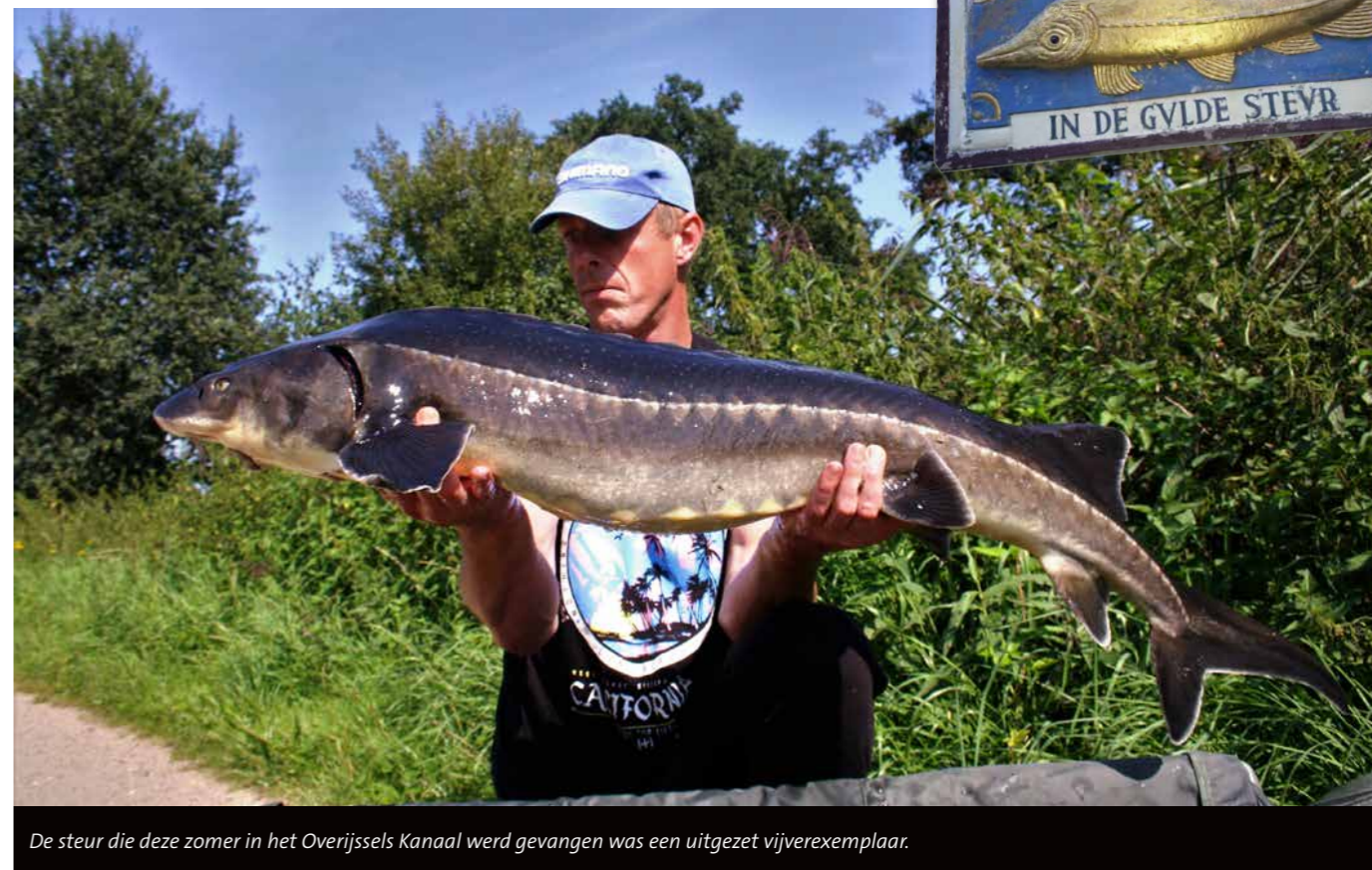
De steur die deze zomer in het Overijssels Kanaal werd gevangen was een uitgezet vijverexemplaar.