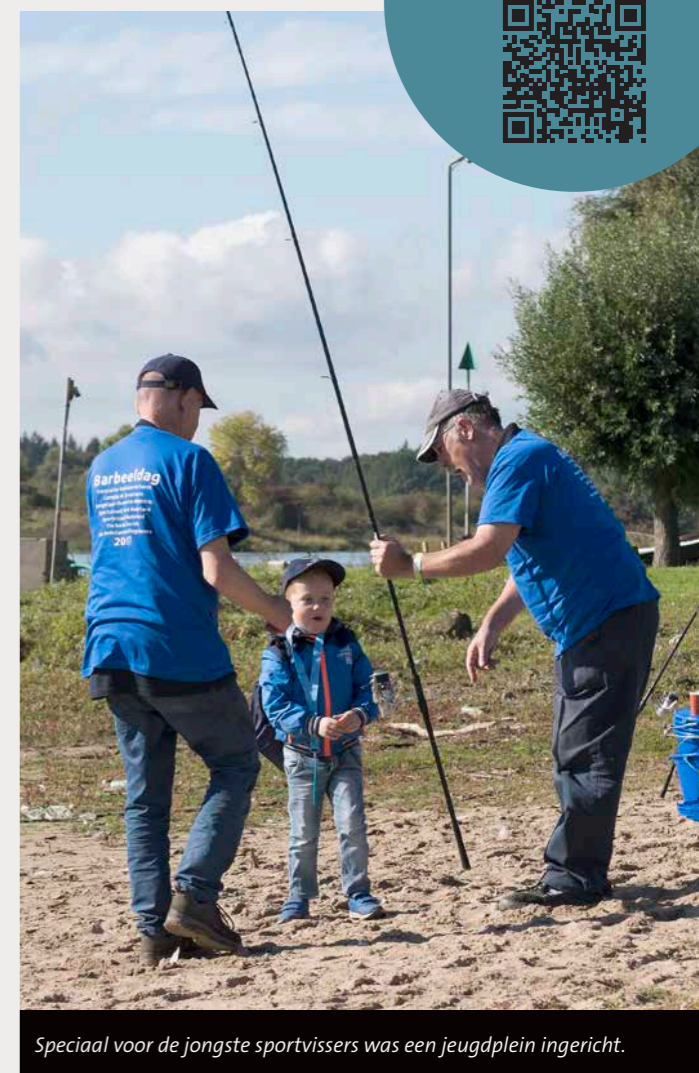
Speciaal voor de jongste sportvissers was een jeugdplein ingericht.

We kunnen terugkijken op een ontzettend mooie en zeer geslaagde Barbeeldag 2017 – en jij ook: scan de QR-Code in de blauwe cirkel voor een impressie van deze fantastische dag aan de IJssel. En we kijken alvast vooruit naar 2018: volgend jaar vindt een nieuwe editie van deze bijzondere praktijkdag plaats. Houd onze website en die van Hengelsport Federatie Midden Nederland in de gaten, want de eerste plannen zijn al weer gesmeed om van de volgende barbeeldag weer een spektakel te maken.