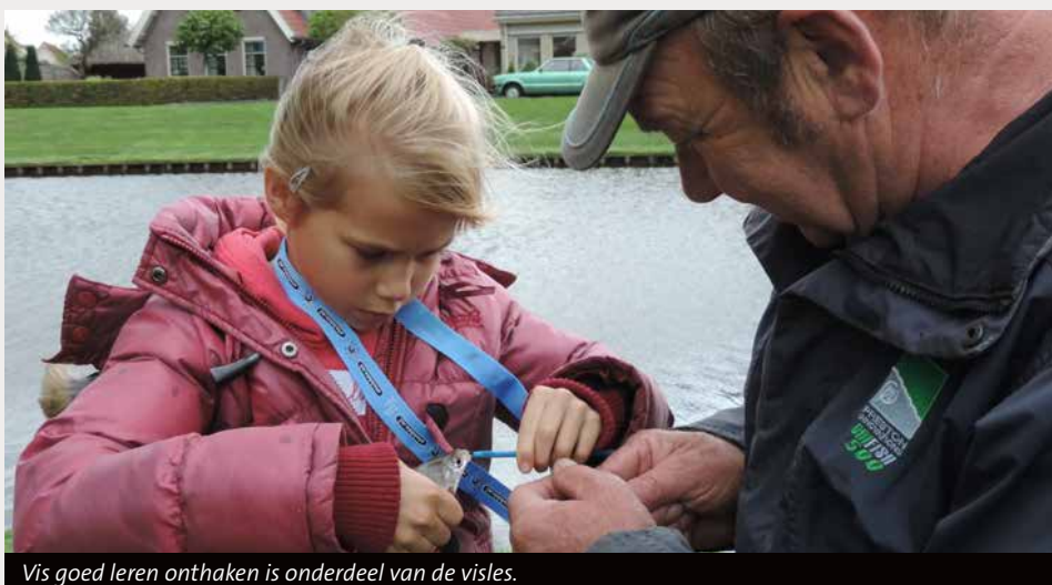
Vis goed leren onthaken is onderdeel van de visles.

zeker in het begin. Je staat er versteld van welke vragen er soms worden gesteld door de kinderen. Zie daar altijd maar eens een goed antwoord op te geven. Al het benodig-