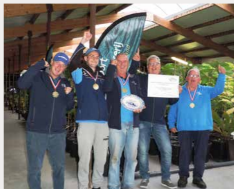
HSV De Dobber Hardenberg werd federatiekampioen 2017.

Na het succes van vorig jaar visten deelnemers van 22 hengelsportverenigingen om de titel Federatiekampioen 2017. Opnieuw deden verenigingen uit alle vier de rayons mee met dit kampioenschap op basis van een knock-out systeem. In de finale aan het Overijssels Kanaal tussen Lemelerveld en Hancate versloeg HSV De Dobber Hardenberg de winnaars van de andere rayons – HSV Haaksbergen, HSV Tot Ons Genoegen Apeldoorn en HSV Steenwijk – zodat zij zich federatiekampioen 2017 mag noemen.