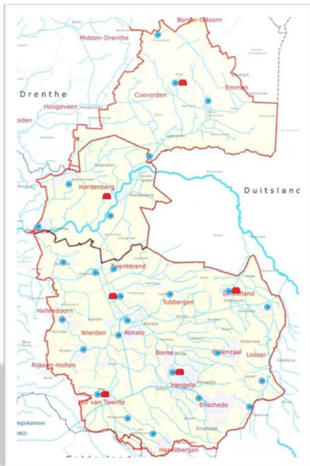
Figuur 1: Werkgebied Vechtstromen