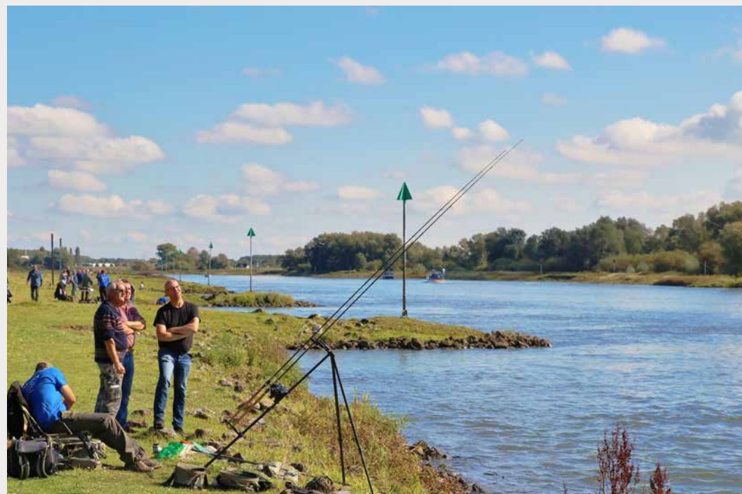
De barbeeldag op 22 september wordt gevolgd door een barbeelwedstrijd op 23 september.

Vorig jaar vond voor het eerst onder grote belangstelling het roofvisseizoen Tock-Fiction plaats langs de IJssel van Zwolle tot Zutphen. Dit evenement was met 100 Duitse sportvissers die deelnamen een groot sportief succes! Van 10 t/m 12 augustus vindt de tweede editie van Tock-Fiction plaats en deze keer worden Nederlandse sportvissers van harte uitgenodigd om ook mee te doen. Deze keer is het evenement uitgebreid van 50 naar 75 koppels! Natuurlijk wil iedereen vis vangen