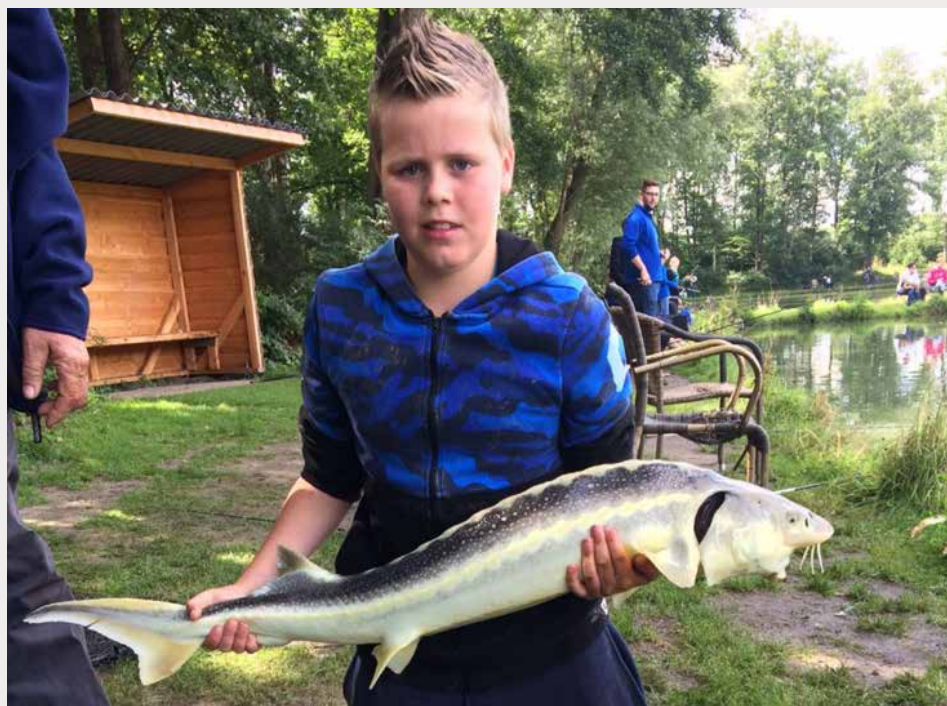
Op 1 juli kan de jeugd van 12 tot 17 jaar op Steur of Meerval vissen.