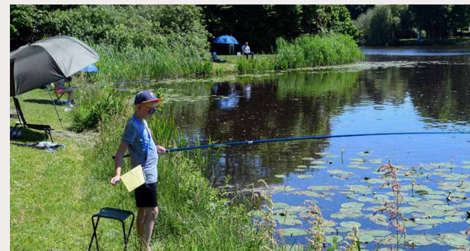
Op Nationale Hengeldag (26 mei) vindt in Raalte de jeugddag plaats.

Wil je meer info en je inschrijven voor de Visgidswedstrijd? Neem dan contact op met Ingmar Boersma: 06 - 50 51 00 55 of ingmar@visgids.nl