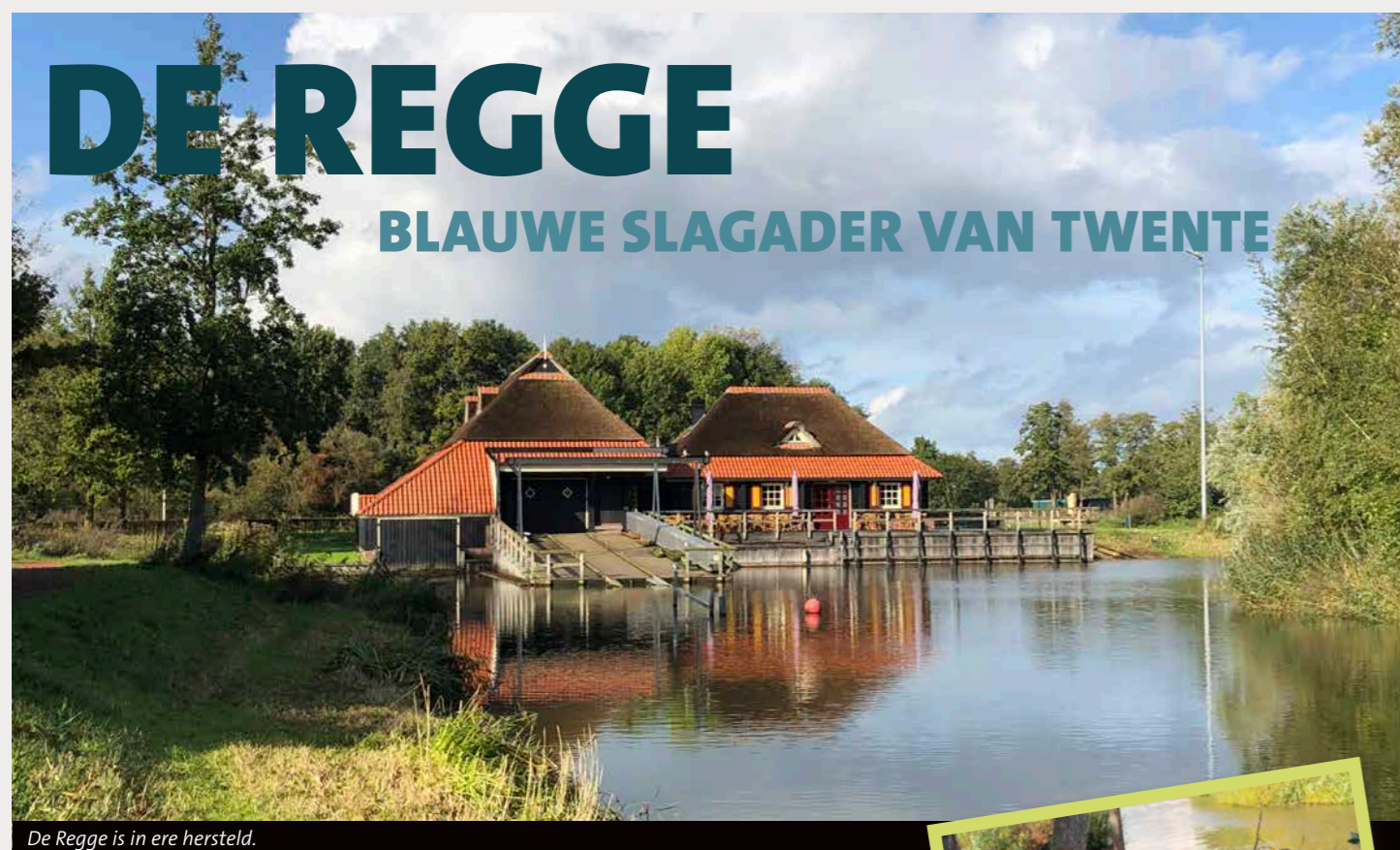
De Regge is in ere hersteld.

Deze ondertitel kreeg in 1998 ook de 'Reggevisie' mee van het toenmalige waterschap Regge & Dinkel. Sinds deze publicatie – een vooruitblik op het jaar 2020 – zijn talloze inrichtingsprojecten langs het riviertje gerealiseerd, van Diepenheim tot Goor en van Marle tot Ommen. De Regge is nu met recht de blauwe slagader van Twente te noemen.