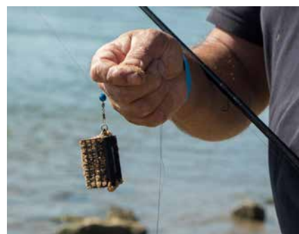
Deelnemers aan de federatieve finalewedstrijd kregen vooraf elk twee loodvrije voerkorven.

Omdat dit het vierde jaar was dat er een Federatief Clubkampioenschap plaatsvond, is het kampioenschap van volgend jaar een lustrumeditie. Het is hopen op een extra groot deelnemersveld met nieuwe kansen om de landelijke titel naar Oost-Nederland te halen.