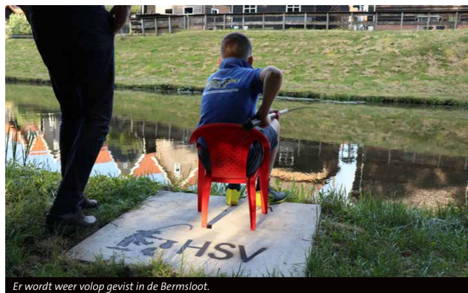
Er wordt weer volop gevestigd in de Bermsloot.

deren er eenvoudig en veilig bij kunnen komen. Er werd al eerder een zomercompetitie gevestigd en elk jaar vinden er gemiddeld tien vislessen plaats. Op de laatste vrijdag van de zomervakantie organiseert de vereniging traditiegetrouw een viswedstrijd voor alle kinderen uit Genemuiden – lid of geen lid.