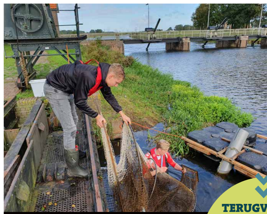
Onderzoekers aan het werk in de Vecht.

Opvallend is dat het aantal gezenderde windes afnam in stroomopwaartse richting. De meeste windes zijn direct na de paai begonnen aan hun terugreis naar de monding van de Vecht. Naar verwachting zwemmen zij volgend voorjaar weer de rivier op om zich voort te planten. Tot en met het voorjaar van 2021 zijn deze vissen te traceren dankzij de zender in hun buik. In 2020 en 2021 zullen nog eens zestig windes zo'n zender meekrijgen. Door het uitlezen van de ontvangers zijn de zwemroutes van de windes