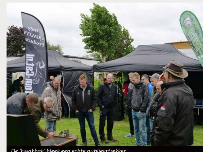
De 'kwakbak' bleek een echte publiekstrekker.

Al met al kijken we terug op een geslaagde eerste editie van Meerval Mania. De plannen voor een tweede editie zijn inmiddels gemaakt. Interesse? Noteer dan alvast zaterdag 6 juni 2020 in je agenda.