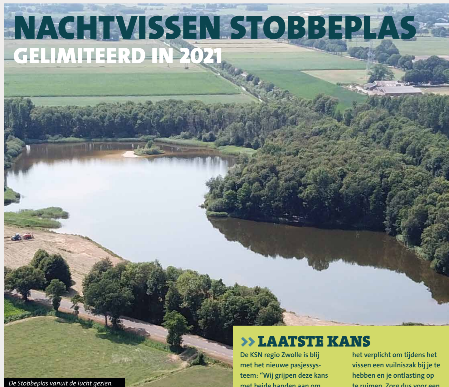
De Stobbeplas vanuit de lucht gezien.

De Stobbeplas is een begrip in Oost-Nederland. Veel (jeugdige) vissers in de regio Slagharen – en ook daarbuiten – kennen de visvijver maar al te goed. Helaas staat het water niet altijd goed te boek. Overlast in de vorm van zwerfafval en kampvuren is al jaren een doorn in het oog van eigenaar Staatsbosbeheer en visrechtgebende Sportvisserij Oost-Nederland. Bij wijze van pilot starten we daarom in samenwerking met de KSN regio Zwolle per 1 januari a.s. met een pasjessysteem, bedoeld om het nachtvisseren in goede banen te leiden.