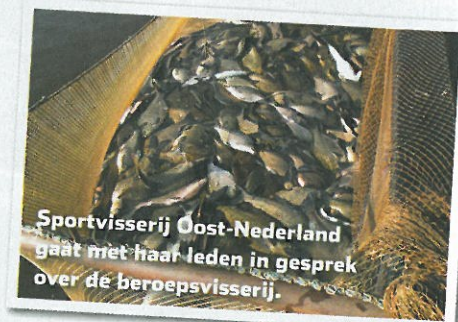
Sportvisserij Oost-Nederland gaat met haar leden in gesprek over de beroepsvisserij.

gedegen toezicht willen we een gezonde visstand bevorderen en tegelijkertijd de beroepsvisserij de kans geven om aan te tonen dat hun bedrijfsvoering hierop is ingericht.