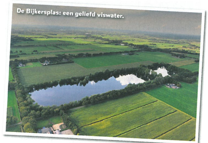
De Bijkersplas: een geliefd viswater.

Op dit moment zijn er geen concrete plannen om in de nabije toekomst nog andere vissoorten