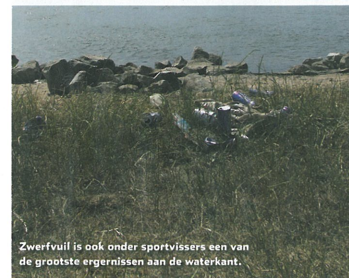
Zwerfvuil is ook onder sportvisserij een van de grootste ergernissen aan de waterkant.

Samen met Cambio, ROVA, Rijkswaterstaat, provincie, gemeenten en terreinbeheerders wordt er op dit moment gewerkt aan een samenwerkingsverband. Er wordt gezocht naar financiering en afvalverwerkingsmogelijkheden. Ook wordt nagedacht hoe verschillende netwerken van vrijwilligersgroepen - zoals verenigingen, sportclubs, dorpsraden, re-integratiegroepen, natuurverenigingen en particuliere grondeigenaren - betrokken kunnen worden bij het adopteren en schoonmaken van een specifiek deel langs de IJssel. De ambitie is om in het voorjaar van 2015 langs de hele IJssel schoonmaakactiviteiten te organiseren. Het is mooi dat dit gezamenlijke probleem nu ook eindelijk gezamenlijk wordt aangepakt!