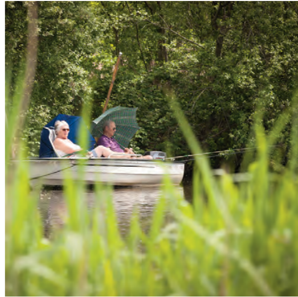
Heerlijk ontspannen in de Weerribben. Rust en ruimte voor zowel de actieve als de passieve visser.

Nationaal Park Weerribben-Wieden in Noordwest-Overijssel is een waterrijke oase van rust en ruimte. Een uniek en afwisselend landschap met rietlanden, plassen, moerasbossen en trilvenen. De ongerepte horizon is bijzonder voor Nederland. Bovendien is Weerribben-Wieden het grootste aaneengesloten laagveenmoeras van Noordwest-Europa met ruim 10.000 hectare! De Weerribben-Wieden is bij uitstek een gebied om op allerlei manieren en in alle seizoenen van het water te genieten. Varen, schaatsen en natuurlijk ook vissen. Net als andere dieren hebben vissen en planten belang bij een goede waterkwaliteit. Deze is de laatste jaren verbeterd. Zelfs de otter, het symbool van de streek, voelt zich hier nu prima thuis.