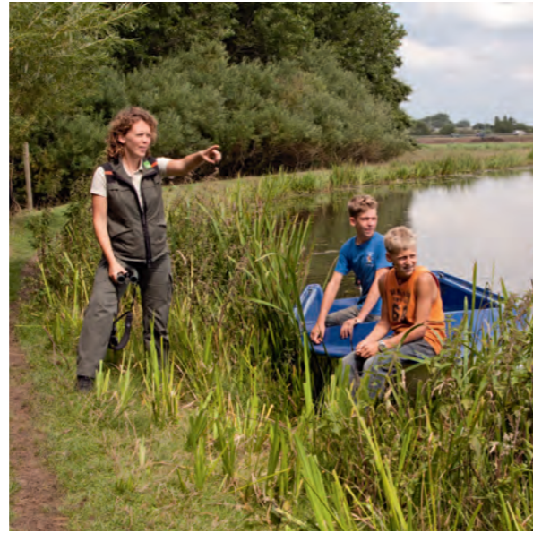
De boswachters vertellen graag over het gebied en wijzen de weg naar de mooiste plekjes.